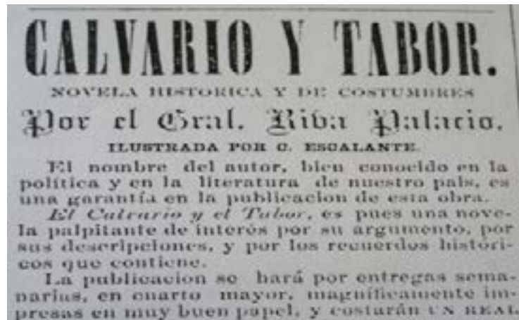
Figura 4. Anuncio de El Demócrata , 1868