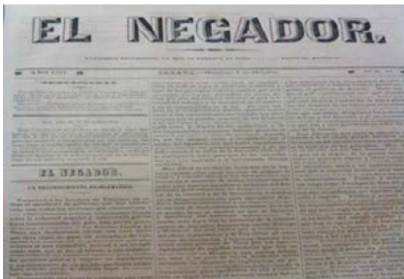
Figura 2. El Negador , 7 de octubre de 1877, núm. 16

A diferencia de las imprentas que funcionaron en la villa de Xalapa, durante el primer cuarto del siglo XIX la de Aburto no sólo evolucionó en el tiraje de los periódicos, sino también utilizó nueva litografía. Desde 1835 hasta 1877 tuvo una variada producción, aunque los periódicos fueron sus publicaciones más importantes, llegando a ocho: El Amigo de la Paz y el Orden (1835), El Conciliador (1839), El Nacional (1841), El Zempoalteca (1845), El Boletín de la Revolución (1855), El Boletín de Jalapa (1865), La Regeneración (1876) y El Negador (1877).