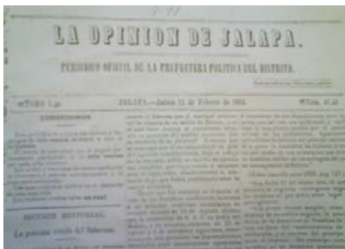
Figura 3. La Opinión de Jalapa , 11 de febrero de 1864

De la producción de periódicos de su imprenta se conoce el tiraje de ocho: La Opinión de Jalapa (1862), El Despertador (1868), El Demócrata (1868), El Pensamiento (1871), La Sombra de Gutiérrez Zamora (1873), El Obrero del Porvenir (1878), El Orto de la Verdad (1878), El Pueblo (1878) y La Esperanza (1878). En ellos se dieron a conocer diferentes opiniones políticas y religiosas, pues unos eran de tinte conservador –entre éstos, los periódicos religiosos– y los menos, de tendencia liberal.