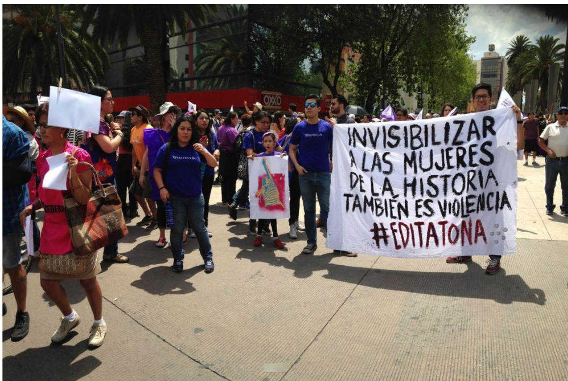
Figura 2. Voluntarias y voluntarios de Wikimedia México en la marcha del 24 de abril contra las violencias machistas.