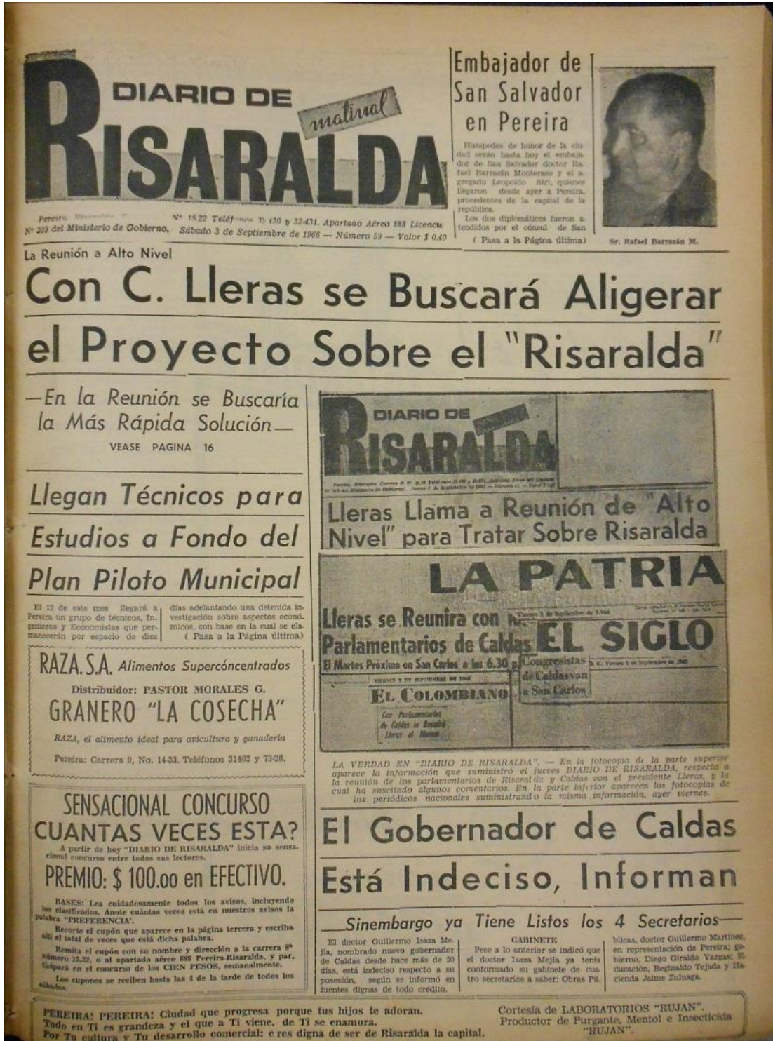
Figura 1. Imagen de periódico. Primera plana Diario de Risaralda