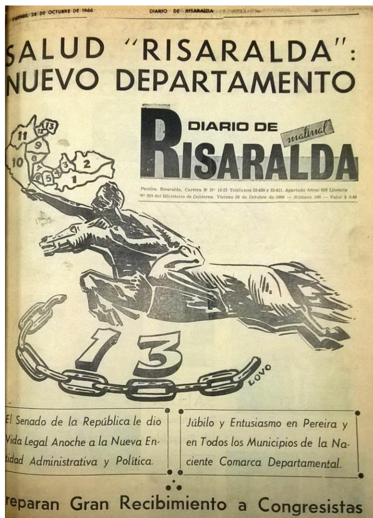
Figura 4. Imagen de periódico. Primera plana, aprobación de Risaralda en la Cámara de Representantes, 26 de octubre de 1966.

La caricatura política de iLOVO! en Diario de Risaralda permite establecer cómo el discurso periodístico apeló durante reiteradas veces a las emociones de los habitantes de Pereira. Fueron múltiples las ocasiones en que iLOVO! acudió a los referentes simbólicos de la historia de Pereira para ponerlos en escena, algunos de ellos fueron el Bolívar Desnudo como lo muestra la figura 4, el Ferrocarril de Caldas, el Aeropuerto Matecaña, la Villa Olímpica y la Universidad Tecnológica de Pereira, etc. Todos ellos son considerados símbolos del llamado Civismo pereirano que emergió con fuerza durante los años veinte y tuvo su punto álgido en los treinta y cuarenta con el liderazgo de la Sociedad de Mejoras Públicas de la ciudad (Correa, 2015).