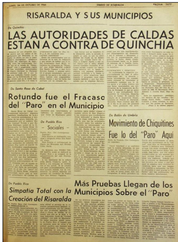
Figura 2. Imagen de periódico: Risaralda y sus municipios en Diario de Risaralda

Por eso se construyó la sesión diaria Risaralda y sus municipios que a nivel de periodismo moderno implicó tener corresponsales en muchos de los pueblos. El objetivo puntual que se tuvo fue el de visibilizar que entre Pereira y los municipios existía una relación de interdependencia y vecindad construida desde muchos años atrás y no coyuntural como se decía desde algunos sectores de la Unidad Caldense. Para hacerlo se exponían las múltiples necesidades y problemáticas que se tenían en cada municipio para fortalecer la idea de Manizales como una ciudad capital ausente, despreocupada y limitante.