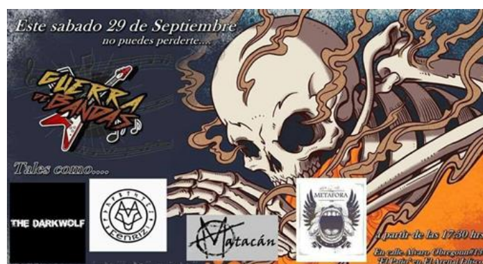
FIGURA 4. Cartel de concierto de punk en El Arenal ( https://www.facebook.com/matacangdl/ ).