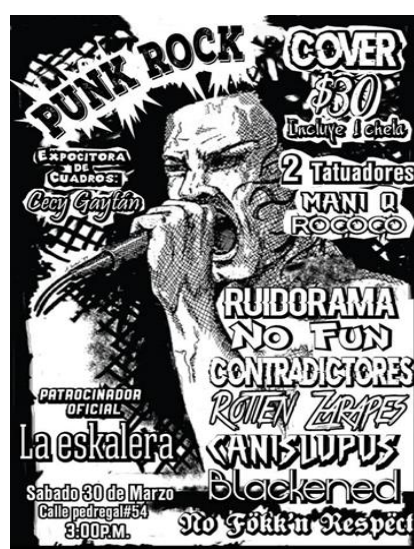
FIGURA 3. Cartel de concierto de punk en Tequila ( https://www.facebook.com/nofunoficial/ ).