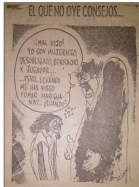
Figura 6. El Diario de Culiacán , 4 de agosto de 1970.

La prensa culiacanense presentaba una dualidad: por una parte, se preocupaba por todas las problemáticas de los jóvenes, pero, por la otra, sentenciaba que al final los mexicanos desearían esas tendencias novedosas y la sociedad impondría su “virilidad”; es decir, que en la práctica las instituciones locales evidenciaban una serie de estrategias para luchar contra la rebeldía y la apariencia de los jóvenes. En este sentido, fue celebrado por El Diario de Culiacán que la Dirección de Acción Social del ayuntamiento de la ciudad implementara un programa de persecución a los “jóvenes vagos” que se la pasaban en “cantinas, billares y prostíbulos” (“Editorial. Combatir la vagancia”, 1965: 4).