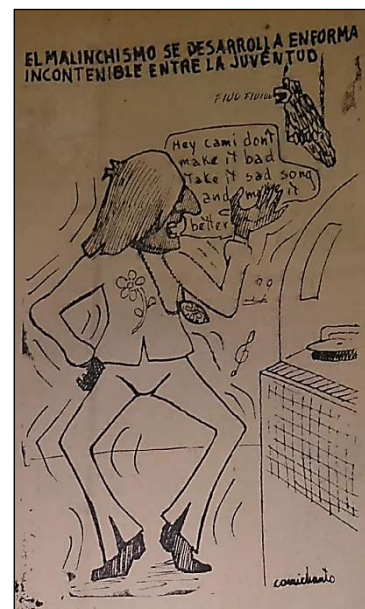
Figura 8. El Diario de Culiacán , 7 de julio de 1969.

En el caso de los jóvenes hombres, la crítica iba más allá de su vestimenta. Algunas veces tenía que ver con el uso del cabello largo, un símbolo de la feminidad, que era mal visto entre los hombres. La figura 7 muestra que, atónito, el padre observa a su hijo mientras este le comenta que no se piensa cortar el cabello porque corre el riesgo de que lo confundan con una mujer. Así que la crítica frente al uso del cabello era también para las mujeres. Se veía mal que los hombres lo usaran largo y que las mujeres lo estuvieran usando corto. En esencia, la crítica iba dirigida a la transgresión de las apariencias tradicionales y heteronormativas.