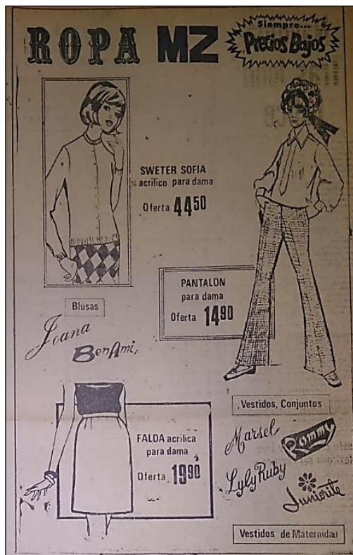
Figura 1. El Diario de Culiacán , 2 de octubre de 1970.

Entre tanto, para los hombres se ofrecía una moda informal, en los pantalones con los estilos slimer , mod o dipper de marca Loredo, que se ajustaban a las piernas y que fueron promocionados como “la nueva onda para los jóvenes” ( Diario de Culiacán , 2 de febrero de 1968: 3); o los pantalones de la marca BAR-LON ( Diario de Culiacán , 2 de octubre de 1970: 2) o los estilo Dandy’s de Delcron ( Sol de Sinaloa , 21 de abril de 1968: 4) que se combinaban con camisas informales, o jerseys con cuello de tortuga o cuello alto ( Sol de Sinaloa 1968a: 6) que seguían el look del rockero bien vestido y moderno (véase la figura 2).