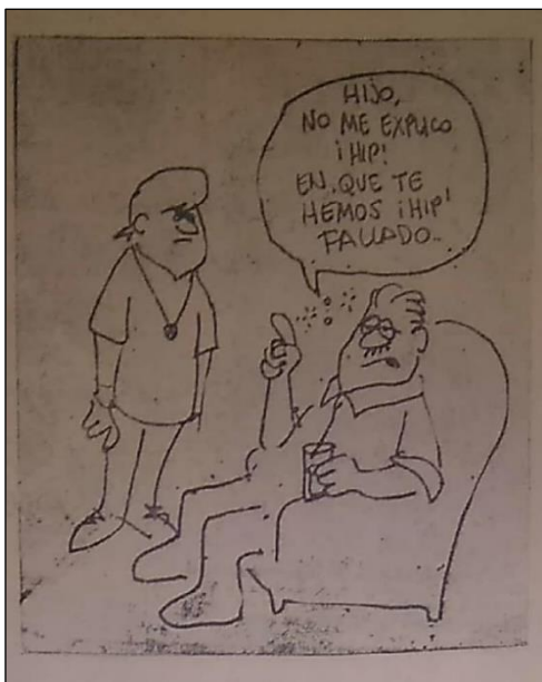
Figura 5. El Diario de Culiacán , 28 de septiembre de 1970.

De esta manera, se simplificaban las elecciones de los jóvenes; es decir, ellos no eran rebeldes por elección propia, porque su carácter los hubiera llevado a optar por una forma diferente de vestirse, por el consumo de sustancias diferentes como la marihuana, sino porque habían sido “víctimas” de un mal ejemplo paterno; así se ponía en cuestión la agencia de los jóvenes rebeldes.