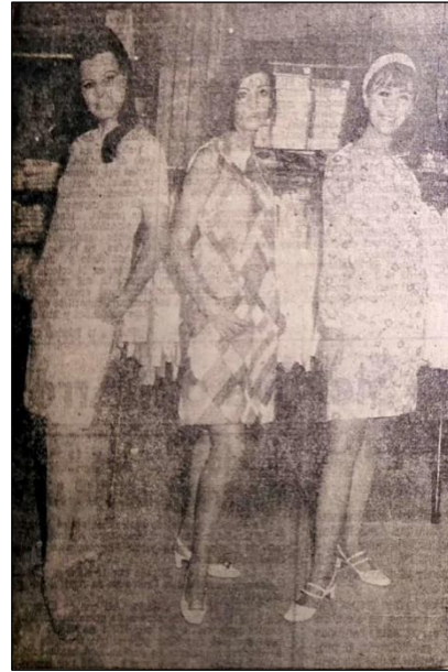
Figura 4. El Sol de Sinaloa , 22 de abril de 1968.

En Sinaloa en los años sesenta convivieron jóvenes de varios tipos e intereses. No fue un asunto de blanco o negro, estuvieron aquellos que continuaron siendo tradicionales, pero también aquellos que se aventuraron y exploraron nuevas indumentarias, estilos y consumos. Se puede decir que la vestimenta tradicional no necesariamente se perdió en la adaptación que hicieron los jóvenes de las vanguardias extranjeras, sino que se transformó. Por ejemplo, los jóvenes culiacanenses podían usar algunos elementos de la indumentaria hippie sin necesariamente compartir el modelo de vida de esta cultura, que seguía siendo vista como algo icónico y lejano.