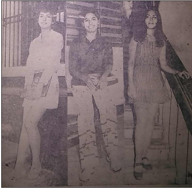
Figura 3. Diario de Culiacán , 20 de septiembre de 1970.