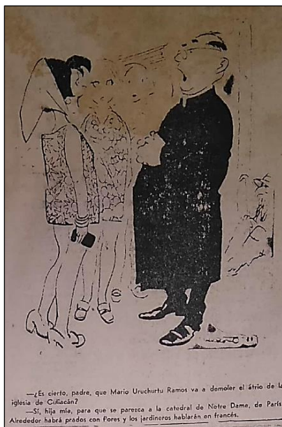
Figura 9. El Diario de Culiacán , 12 de junio de 1969.

El cardenal consideraba oportuno dar esta terminante orden, ya que la moda día a día se hacía más exagerada; por consiguiente, más inmoral. En dicho edicto, no solo se pedía la cooperación de Acción Católica, Acción Católica Femenina, Movimiento Familiar Cristiano, Cursillistas de Cristiandad, Congregaciones Marianas y Damas de la Caridad, sino de forma muy especial la de los padres de familia y los esposos (Plascencia, 2015: 177).